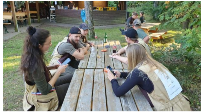
Unser Team vor dem nächsten Durchgang

Wir haben dann noch die Teilnehmerliste für den 14.10.2023 aufgestellt. Da ist dann das Junioren – Pokal – Schießen der KJS – Flensburg auf dem Schießstand in Bilschau und auch hier werden wir wieder mit einer vollen Rote antreten können.